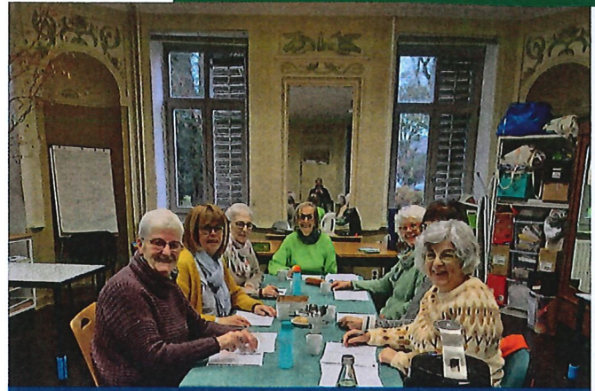
Le groupe francophone (Cercle des lecteurs) dans l'ancienne maison communale (19/11/2025)

Ce qui est enthousiasmant en animant ces groupes, ce sont les avis des participants :