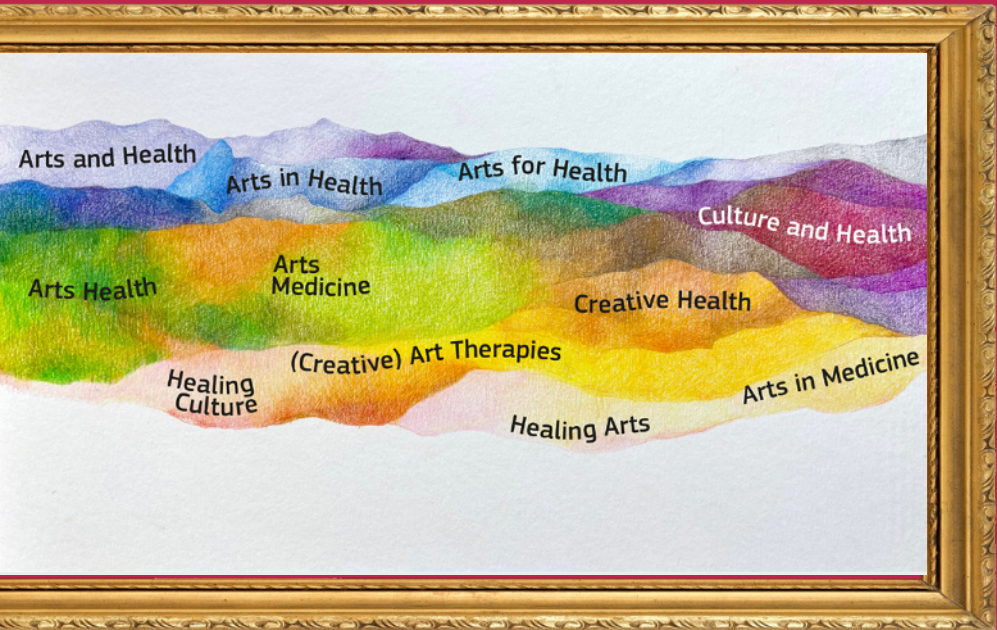
▲ Landschap van het gebied cultuur en gezondheid.